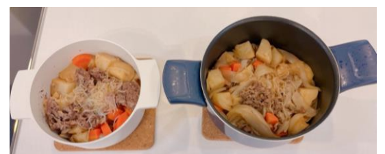
左・Leggiero 右・普通の鍋